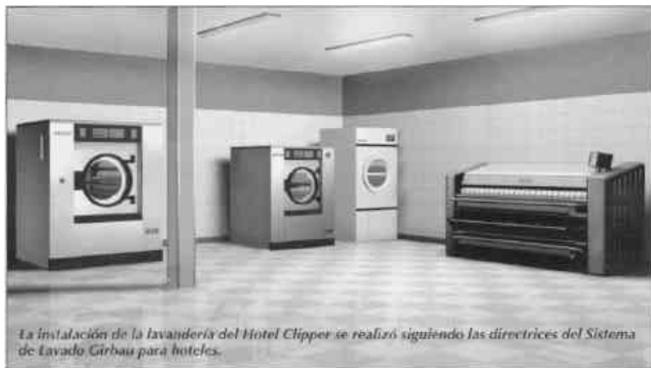
La instalación de la lavandería del Hotel Clipper se realizó siguiendo las directrices del Sistema de Lavado Girbau para hoteles.

Con el sistema de lavado Girbau se puede llegar a conseguir un ahorro de hasta el 40 por 100. Toda la maquinaria fabricada por Girbau está diseñada pensando en criterios de máxima rentabilidad, durabilidad, ergonomía y respeto al medio ambiente. Así, las lavadoras-centrifugadoras de la serie HS-4000 instaladas en el Hotel Clipper disponen del sistema G-Drive, que consigue prestaciones