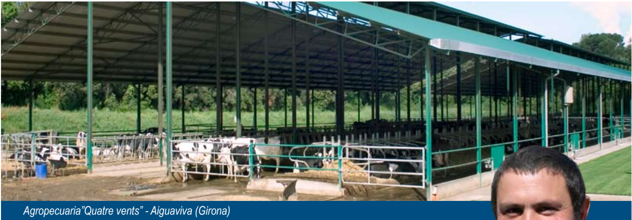
Agropecuaria "Quatre vents" - Aiguaviva (Girona)